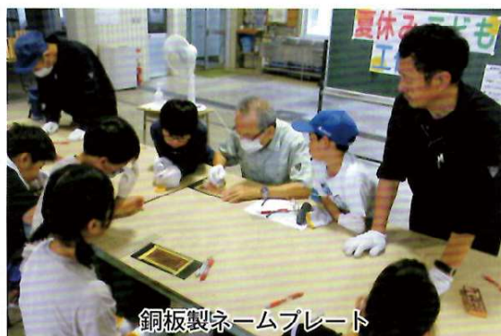
銅板製ネームプレート