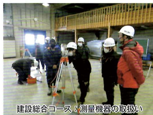
建設総合コース：測量機器の取扱い