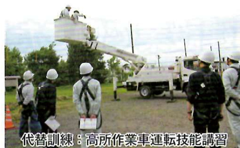
代替訓練：高所作業車運転技能講習