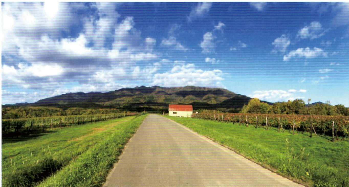
ワイン用ブドウ畑から樺戸連峰を望む

●発行先／一般社団法人 中空知地域職業訓練センター協会 TEL 0125-24-1880 9月1日発行